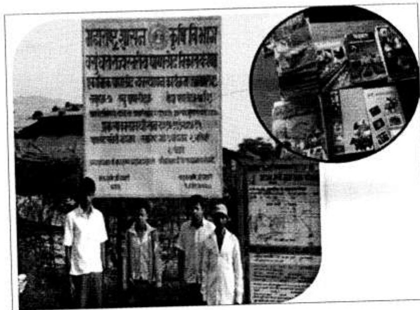
Pashane Village Board and EPA Activity

Population of the village is about 1596. Main community of village is Kunbi. Majority of people are going to nearby city Mumbai for employment. IWMP project was started in village in 2010-11 by PIA, TAO, Karjat. Pashane watershed committee is having treatment area of 436.27 ha with cost 65.44 lakh.