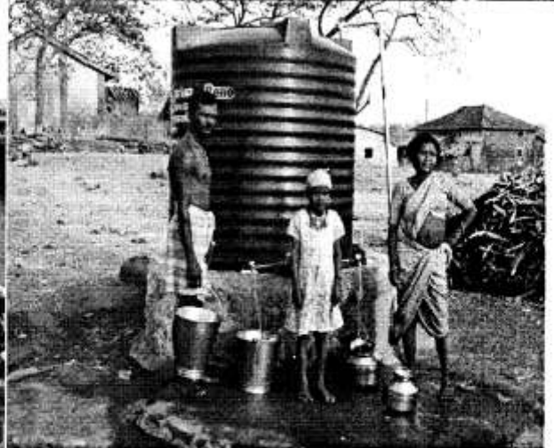
पोही येथे आदिवासी वस्तीवर पाणी भरतांना महिला. १९°०५'२४.२० एन. ७३°२३'०८.२० ई